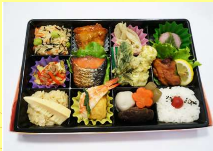
まごころ込めた手作りの味