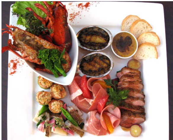
■ カロツツアプレート (4人前) ¥13,000 (税別)