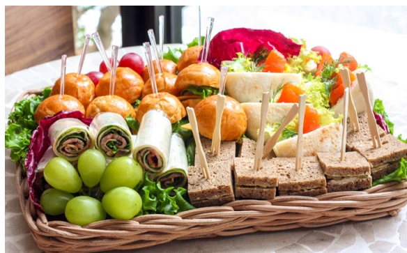
■ サンドイッチプレート ¥6,000 (税別)