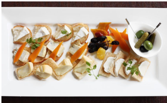
■ フロマージュ ¥2,000 (税別)