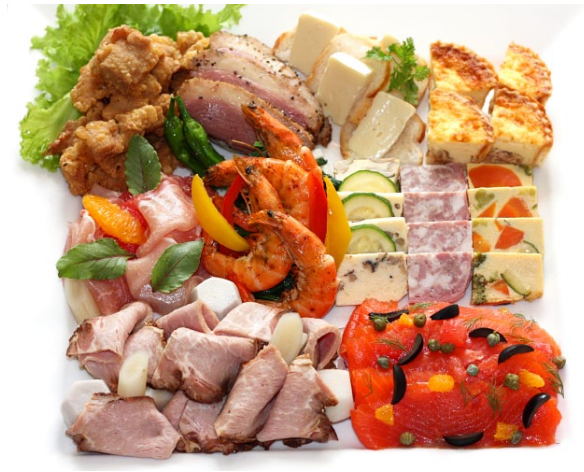
■ おもてなしプレート (4人前) ¥7,000 (税別)