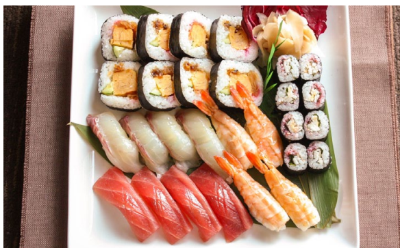
■ お寿司盛り合わせ (4人前) ¥4,000 (税別)