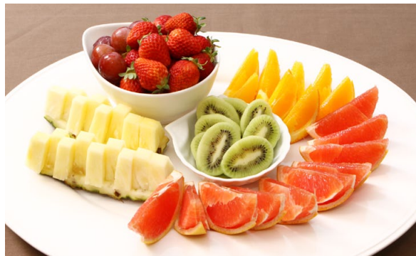
■ フルーツ ¥2,000 (税別)